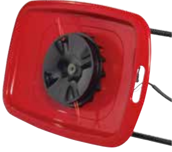
Naylon Tel Kesici – (HoverPro 400 & 450)

Toro HoverPro, eğimli arazilerde, inişli çıkışlı dar zeminlerde, su veya çukur kenarlarındaki alanlarda çim bakımına çok uygundur. Hafifliği HoverPro'nun kullanımını kolaylaştırırken sağlam tasarımı uzun yıllar kaliteli performansı garanti eder.