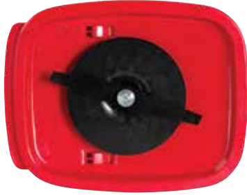
Çelik Kesme Bıçağı – (HoverPro 500 & 550)